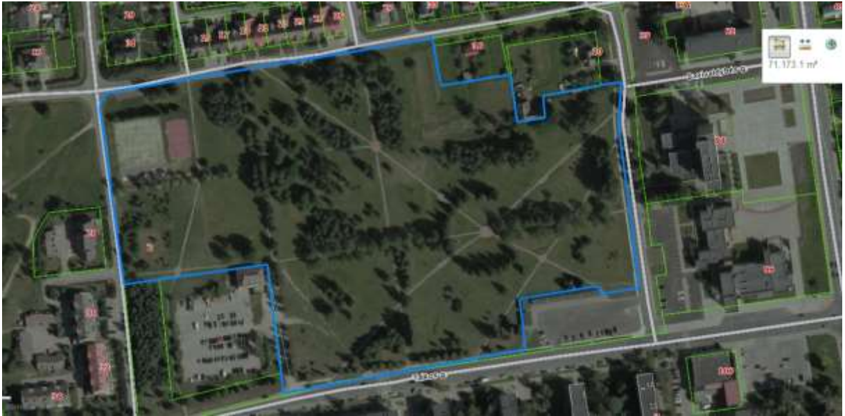
2 schema. Rokiškio ežero rekreacinė zona (Ežero g. 1 A, Rokiškis)