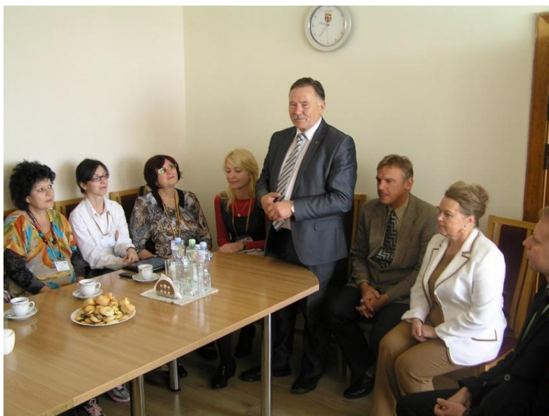
Daugiašalės mokyklų partnerystės projekto dalyvių susitikimas su savivaldybės meru

Aktyviai tarptautinius ryšius vystė rajono švietimo darbuotojai. Pagal naują Erasmus+programos 2 pagrindinį veiksmą „Strateginės partnerystės“ Rokiškio Juozo Tumo-Vaižganto gimnazija pradėjo vykdyti naują projektą su Čekijos ir Bulgarijos mokyklomis. Rokiškio jaunimo centras, vykdydamas tarptautinius projektus, glaudžiai bendravo su Latvijos Respublikos Jėkabpilio, Plavino ir Cėsių pedagogais bei jaunimu. Suaugusiųjų ir jaunimo centras, įgyvendindamas tarptautinį Grundtvig programos senjorų savanorystės projektą, vasarą priėmė svečius iš Lenkijos. Rokiškio lopšelis-darželis „Varpelis“ dalyvavo Comenius daugiašalės mokyklų partnerystės projekte pagal Mokymosi visą gyvenimą programą (tikslas – keistis mokymo(-si) strategijomis, programomis, naujoviškomis mokymo praktikomis, ieškoti šiuolaikiškų ugdymo būdų ir metodų, perteikiant vaikams mokslinius dalykus bei skatinti pedagogų gerosios patirties sklaidą). 2014 09 28–10 05 dienomis vyko trečiasis partnerių susitikimas Lietuvoje, kuriame dalyvavo Turkijos, Bulgarijos ir Rumunijos komandos. Spalio 1 d. svečiai susitikimas su rajono savivaldybės meru ir administracijos darbuotojais.