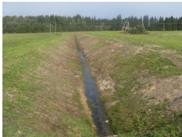
Melioracijos griovys Petriošiškio kaime, Kamajų seniūnijoje (prieš ir po darbų)

Per 2011 metus įregistruota, perregistruota, išregistruota 568 vnt. technikos, atlikta 2571 techninių apžiūrų.