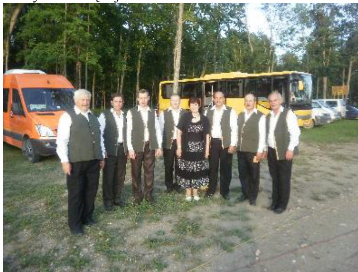
Seniūnijos delegacija Salų savivaldybėje (Latvijos Respublika)

Dalyvauta rajoninėje meno kolektyvų apžiūroje Juodupėje bei Leliūnuose Anykščių rajone; kulinarinio paveldo pristatyme Biržų rajone.