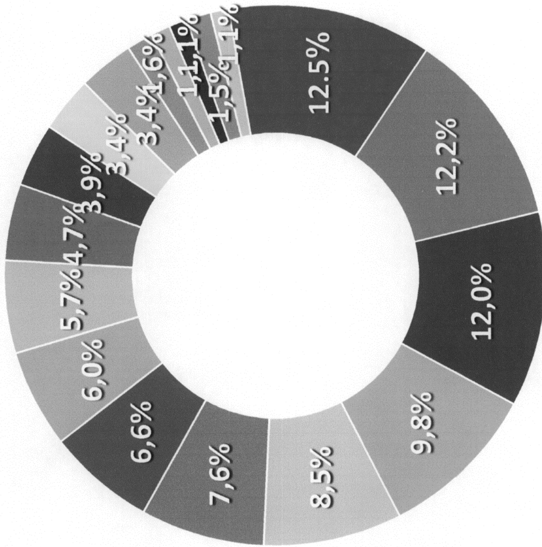
2 pav. Daugiavaikėms šeimoms reikalingos nuolaidos