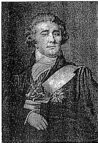
J. Piszka. Portret Ignacego Tyzenhauza, szefa gwardii lit.

Privatumas · Sąlygos · Reklama · AdChoices · Stapukai · Daugiau · Facebook © 2017