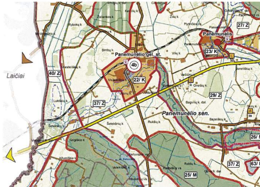
3.1.1. pav. Rokiškio rajono savivaldybės teritorijos bendrasis planas, Žemės naudojimo, tvarkymo ir apsaugos reglamentų brėžinys.

Planuojamoje teritorijoje galioja Rokiškio rajono savivaldybės teritorijos bendrojo plano sprendiniai (3.1.1. pav.). Planuojama teritorija yra Panemunėlio gelž. st. šiaurės rytų pusėje, Pergalės gatvėje, šalia rajoninio kelio Nr. 3605.