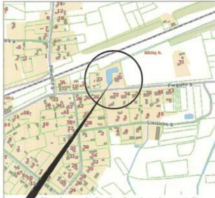
Planuojamos teritorijos situacijos schema (www.regia.lt)